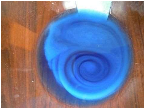
MŮŽEME PŘIMÍCHAT I MLÉKO