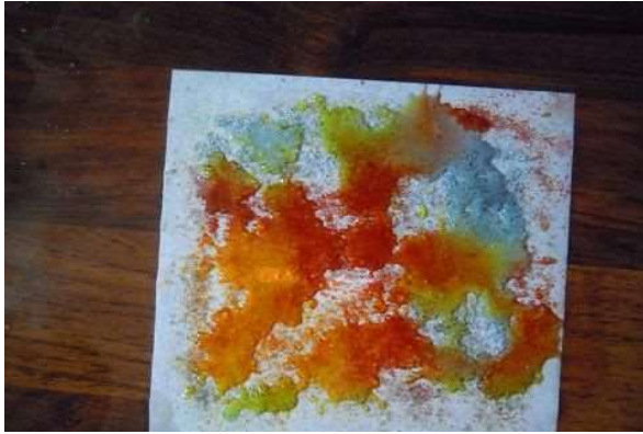
CUKR NALEPENÝ NA PAPIRU POSYPANÝ BARVAMI